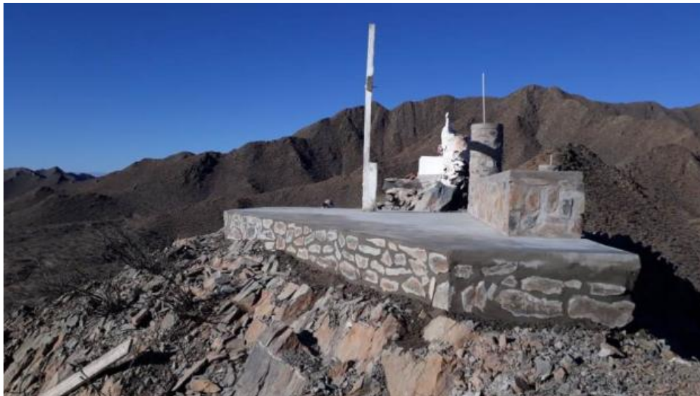
Casa de la Magia